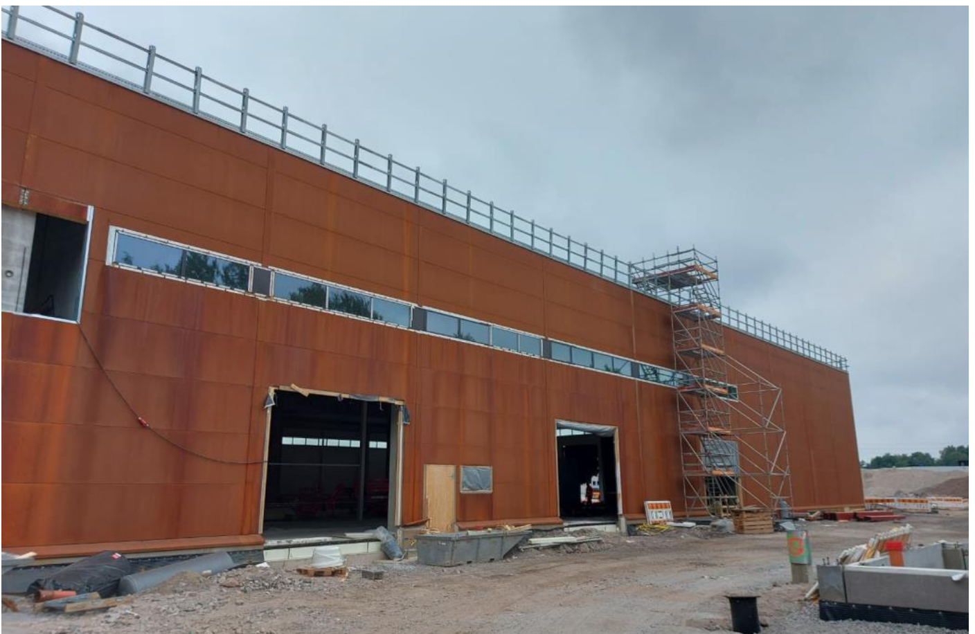
D-lohko – pohjoinen julkisivu