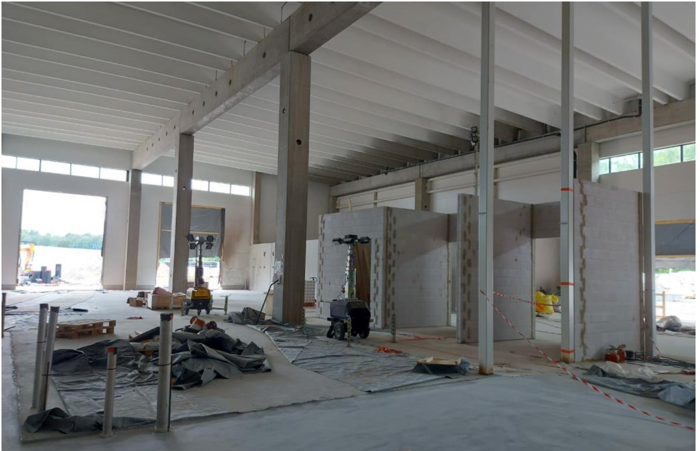
D-lohko – väliseinämuuraukset käynnissä