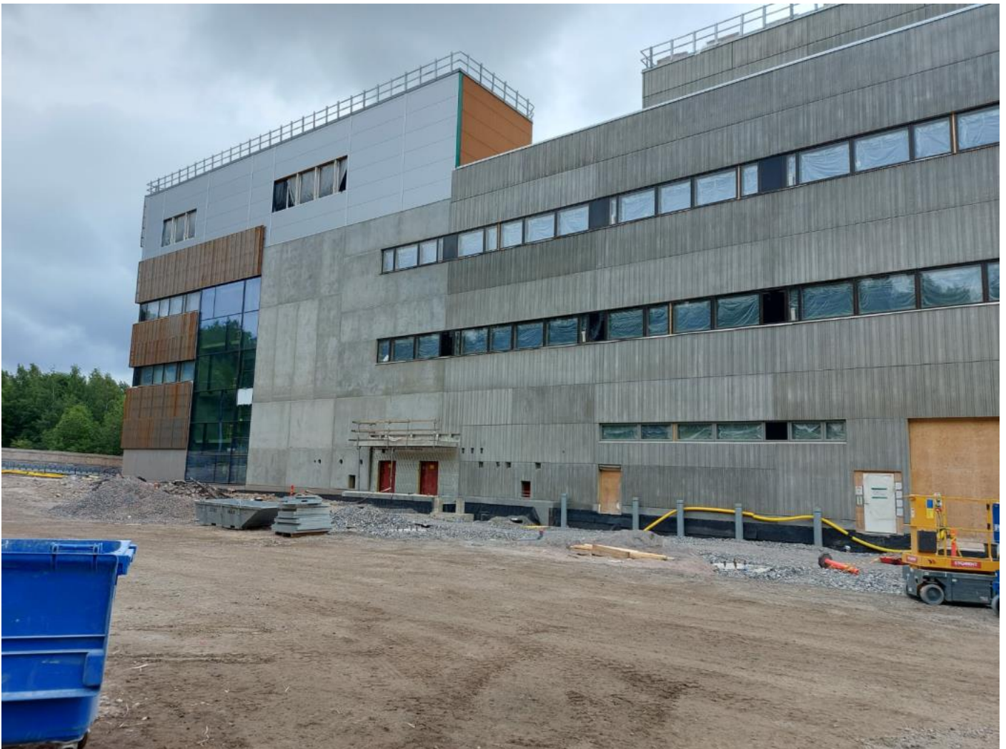
Pohjoinen julkisivu – A-lohko