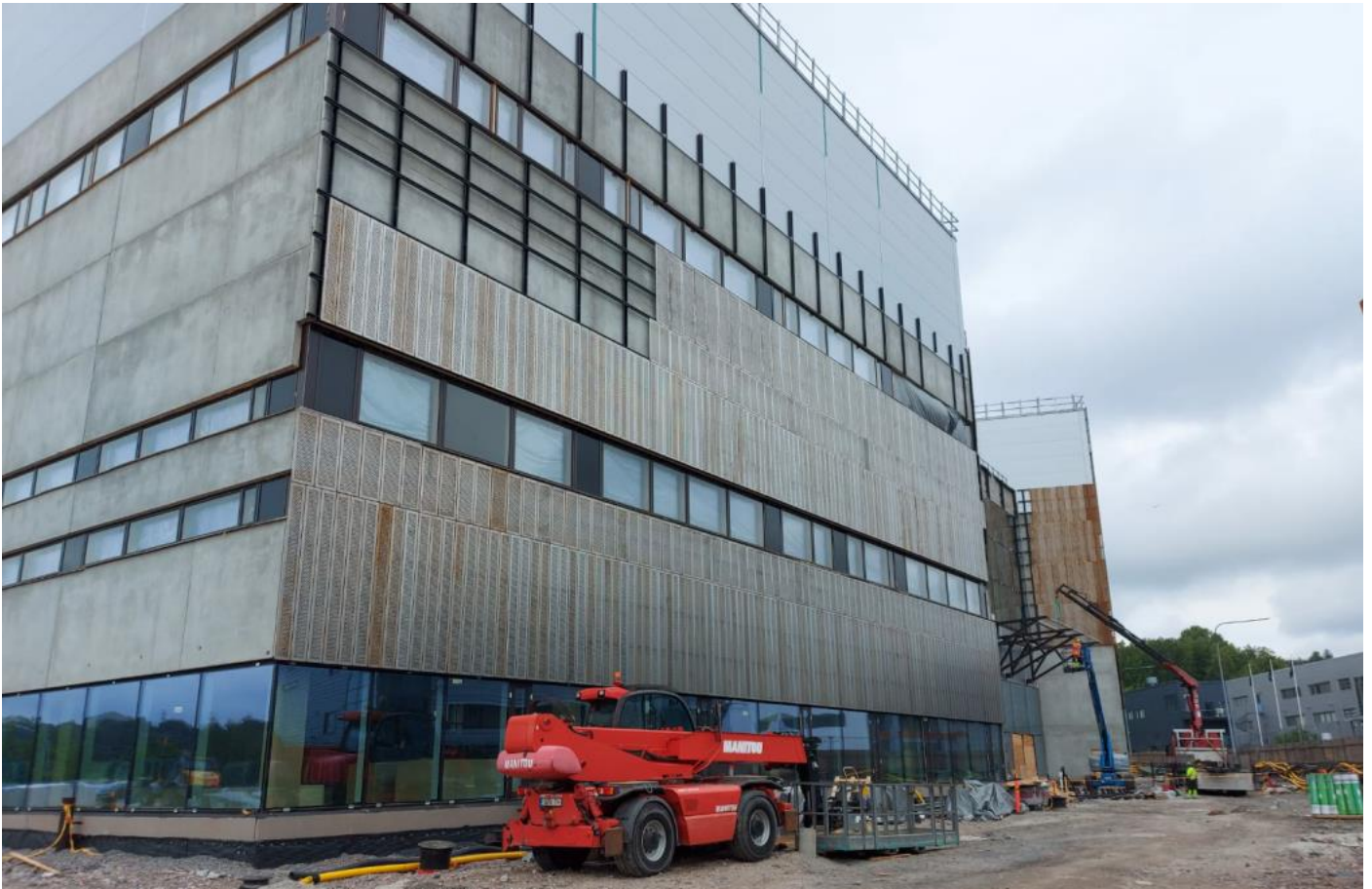
C-lohko – julkisivu itään