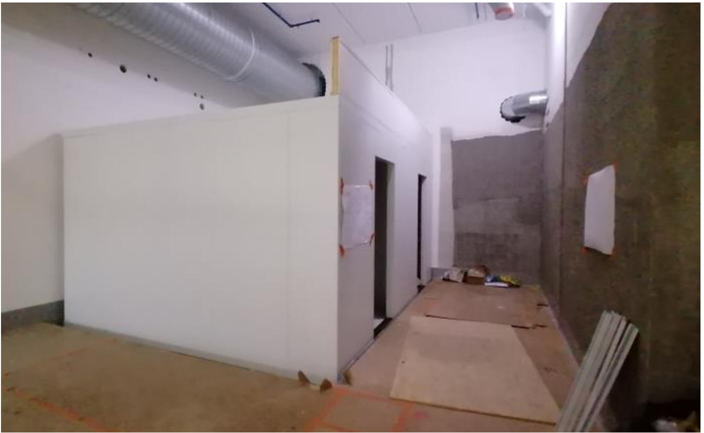
Keittiön kylmiöiden asennustyöt