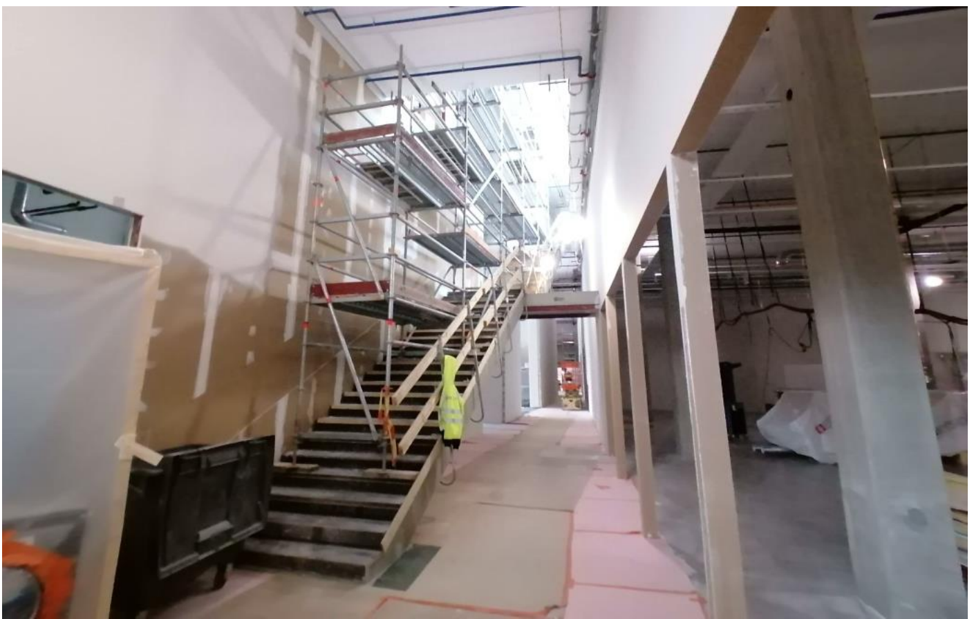
B-lohko 1. krs