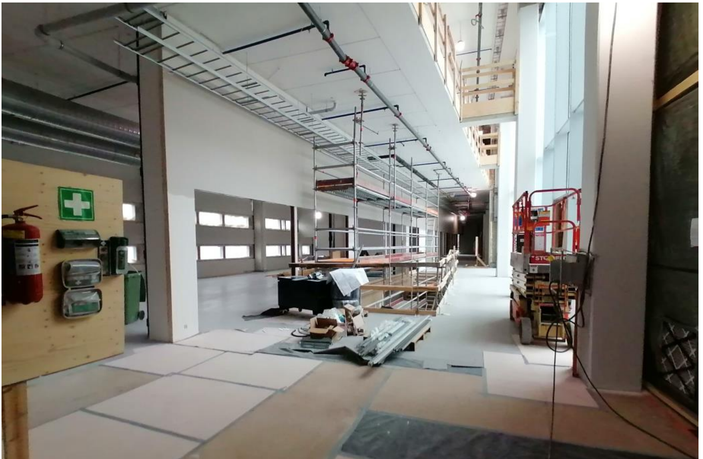
B-lohko 2. krs