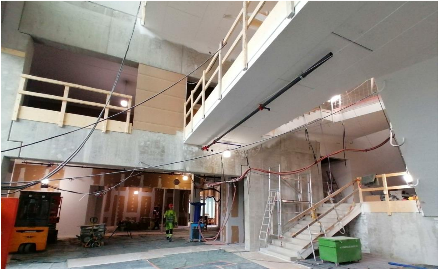
C-lohko sisäänkäynnin aula 1. krs