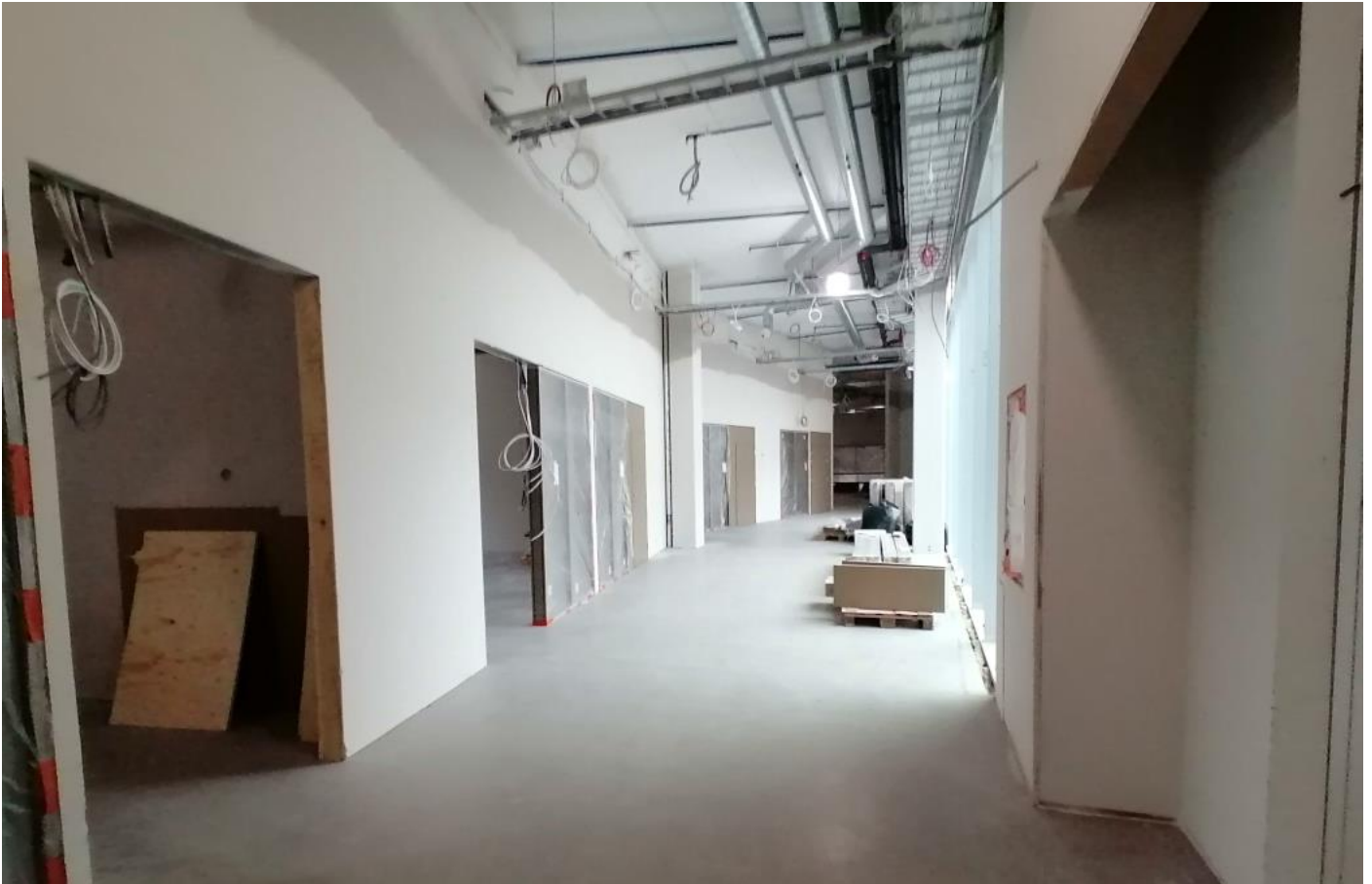
A-lohko, sisälaseiseiniä ja -ovia asennukset