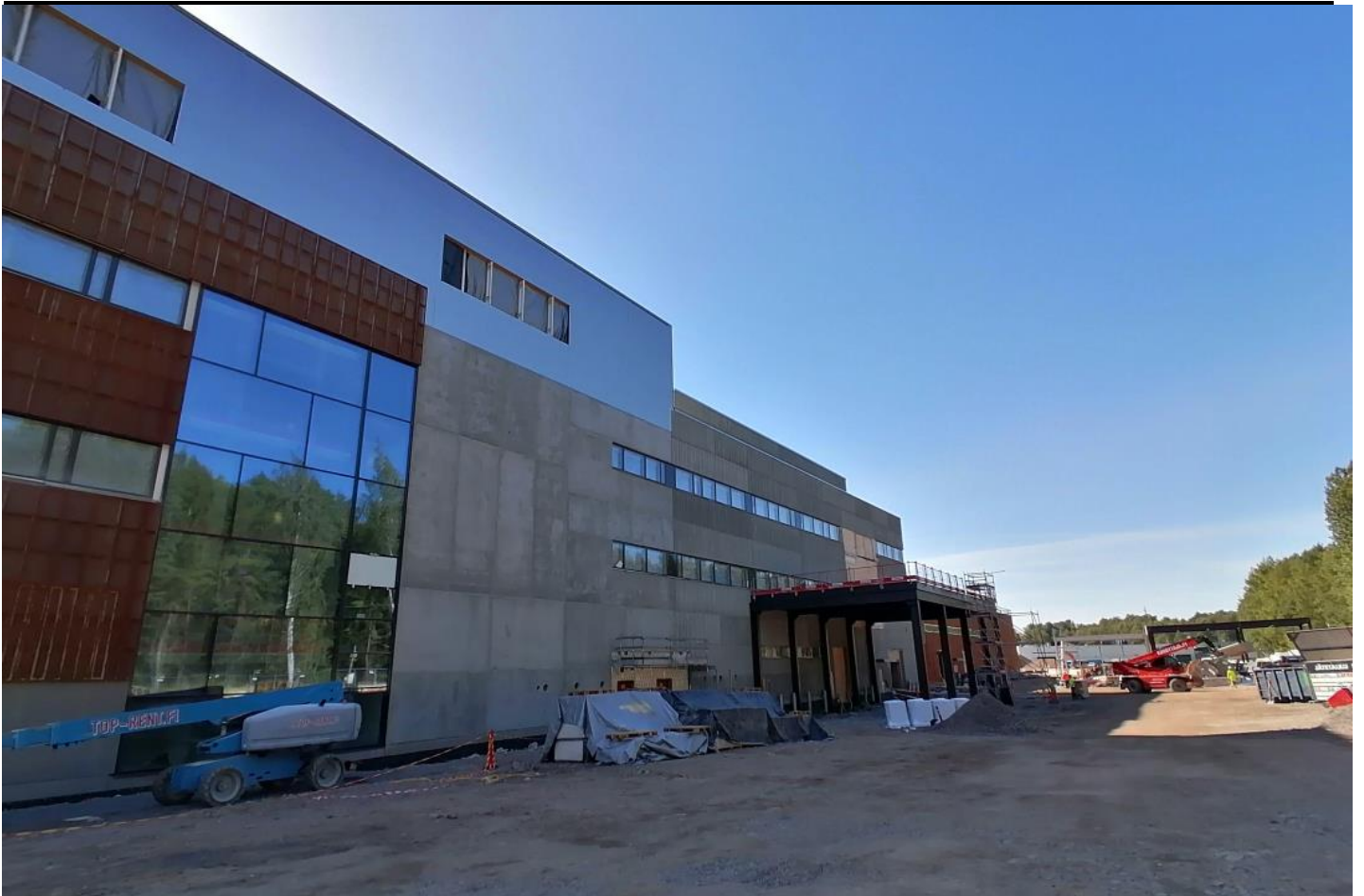
Pohjoinen julkisivu, taustalla pihavarasto