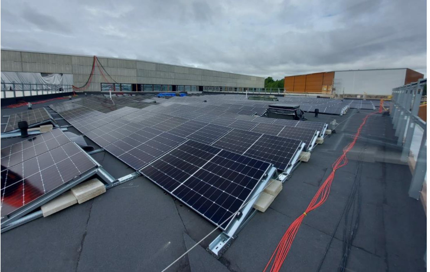
Aurinkosähköjärjestelmätyöt käynnissä vesikatolla