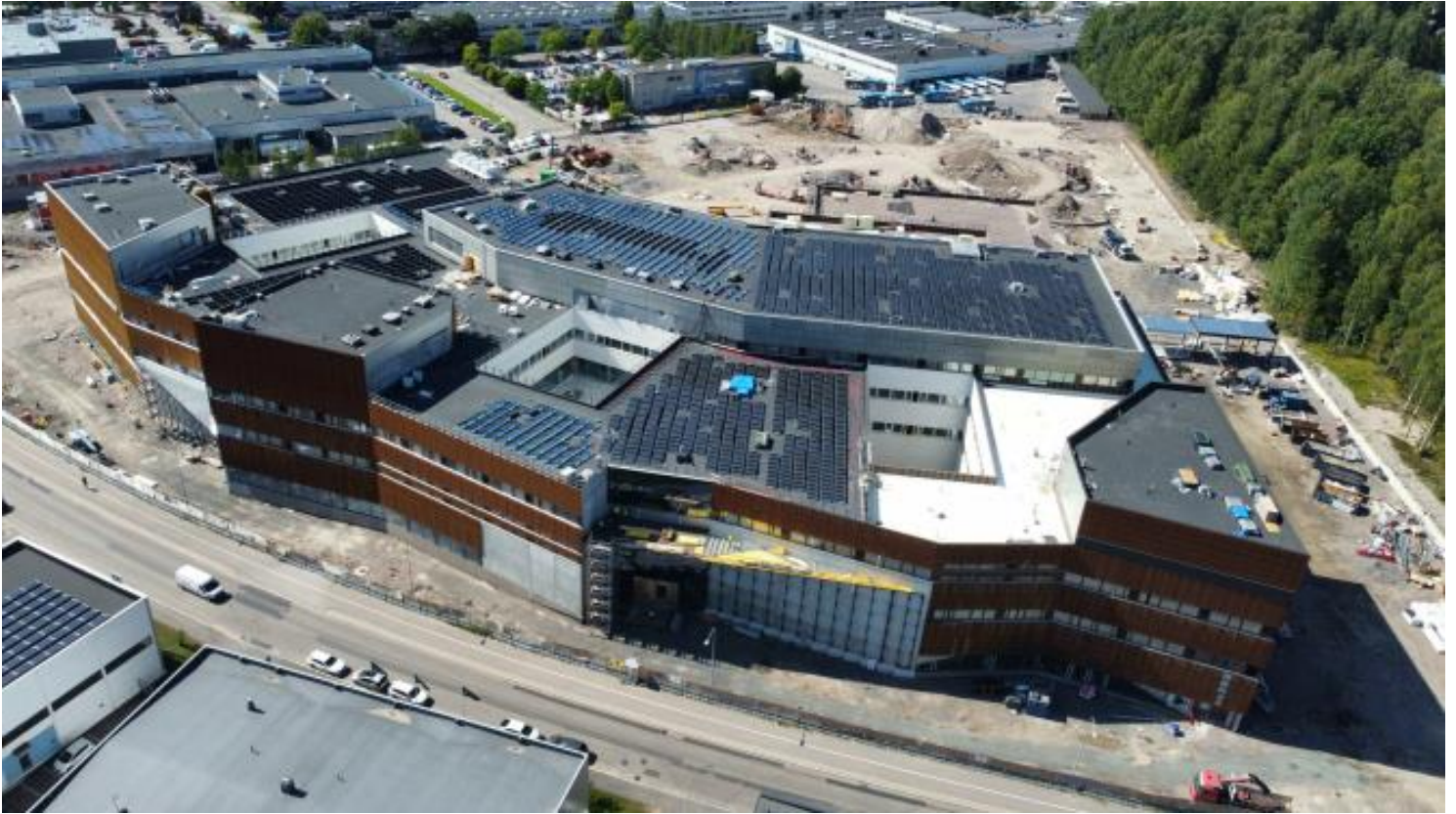
Vesikatto / aurinkopaneelit