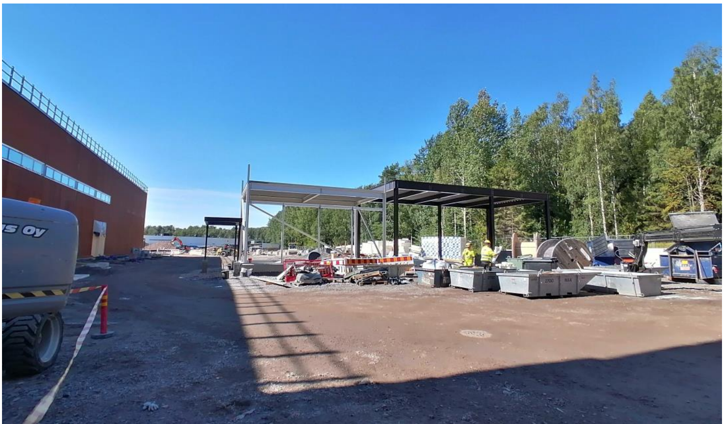
Pihavarasto, teräsrakenteet asennettuna