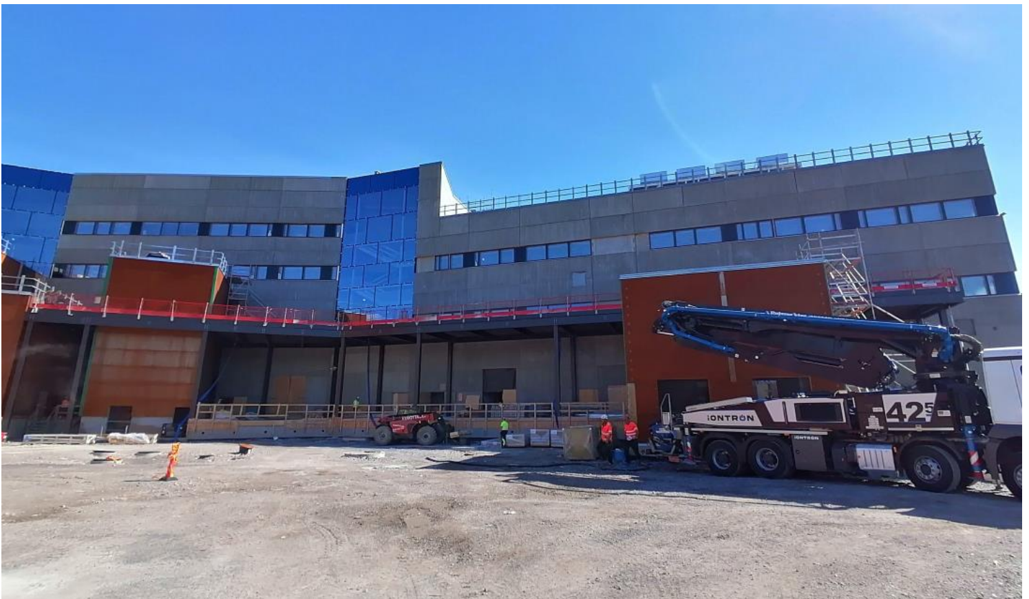
Lastausalue ja -laituri sekä talovarasto, B/C-lohko