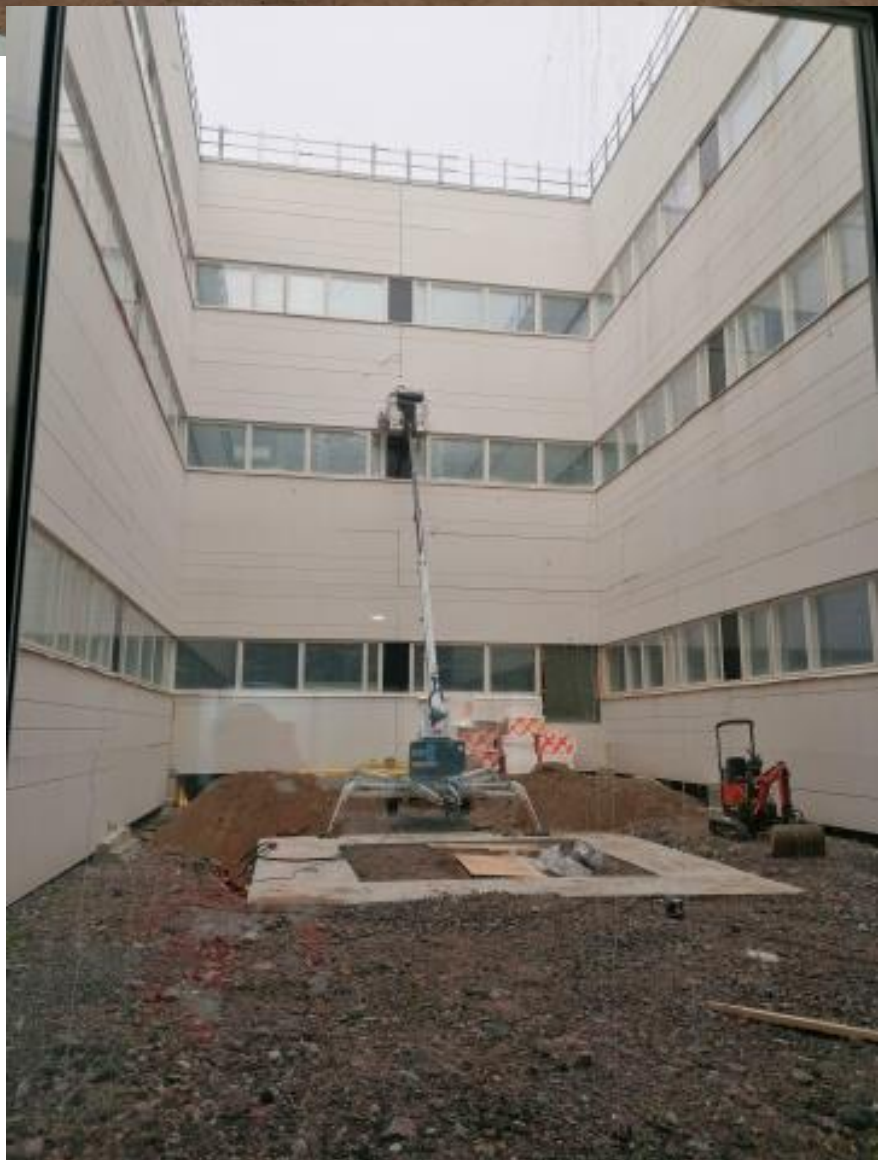
C-lohko, Sisäpihan julkisivusaumaukset