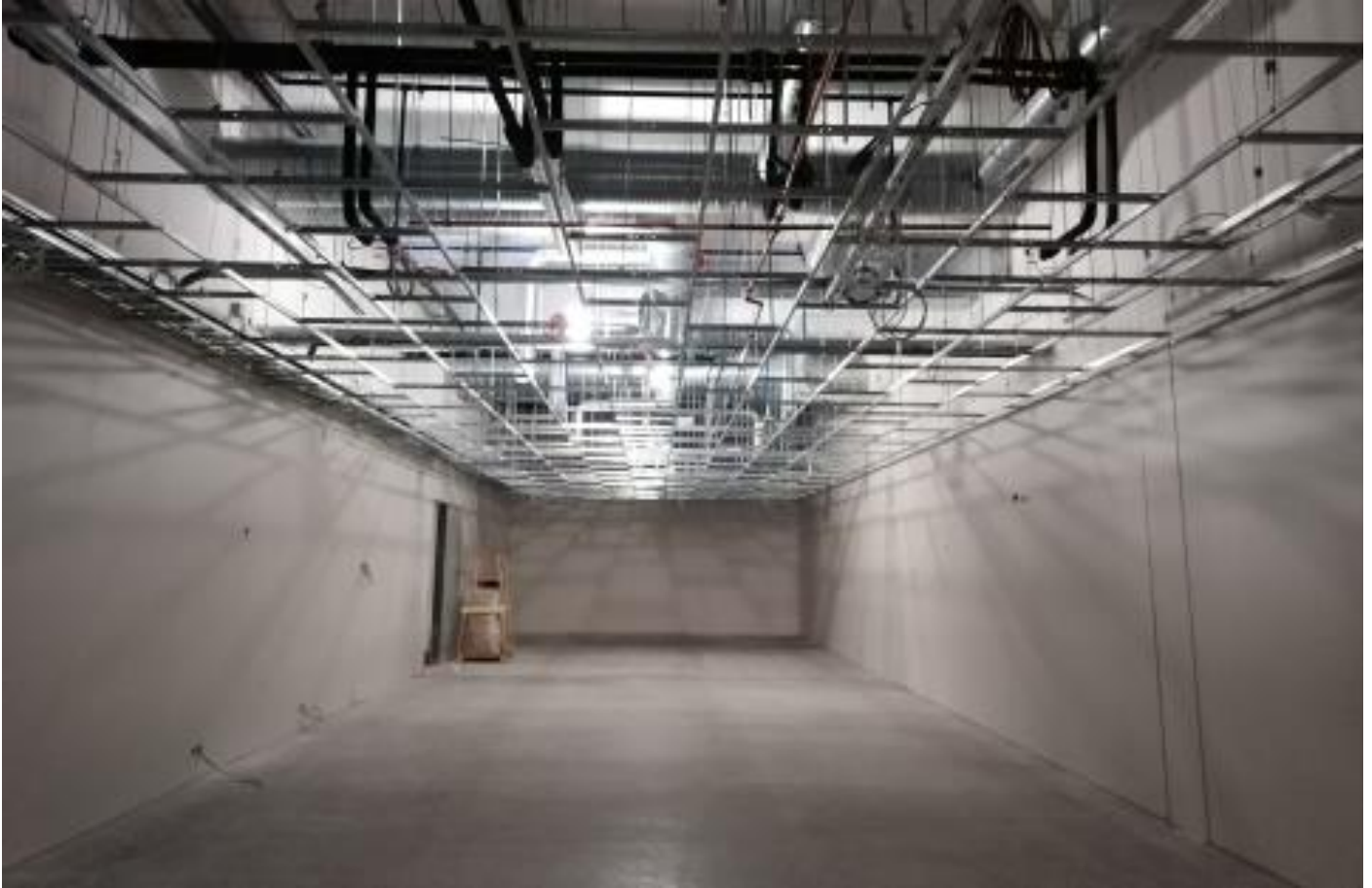
B-lohko 2. krs, alakattorunkojen asennus