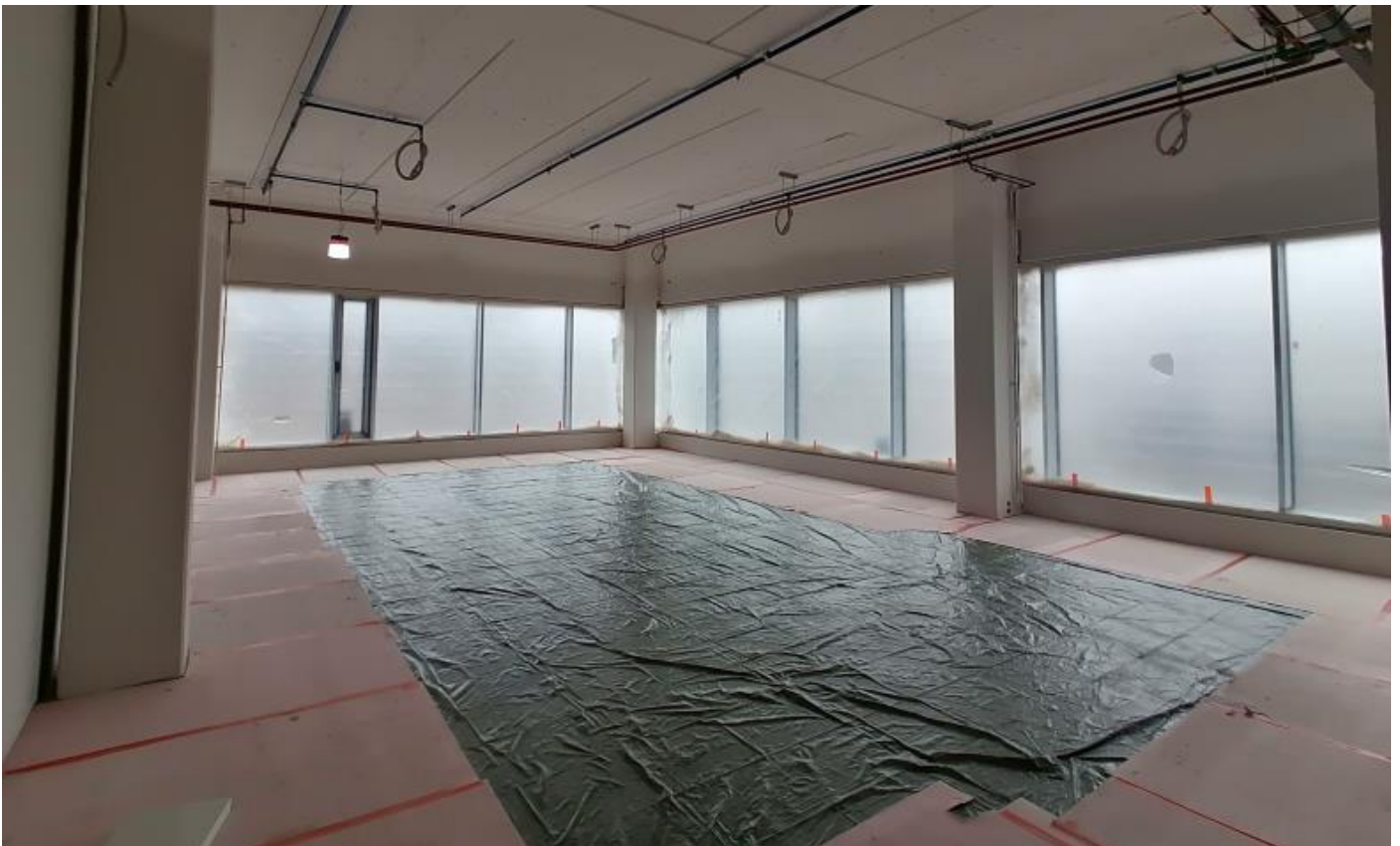
C-lohko 1. krs, Oleskelutila (keittiöllä)