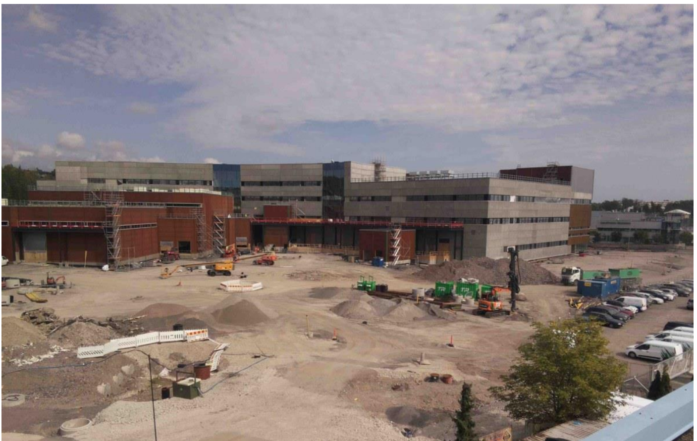
Piha-alue, Julkisivu länteen