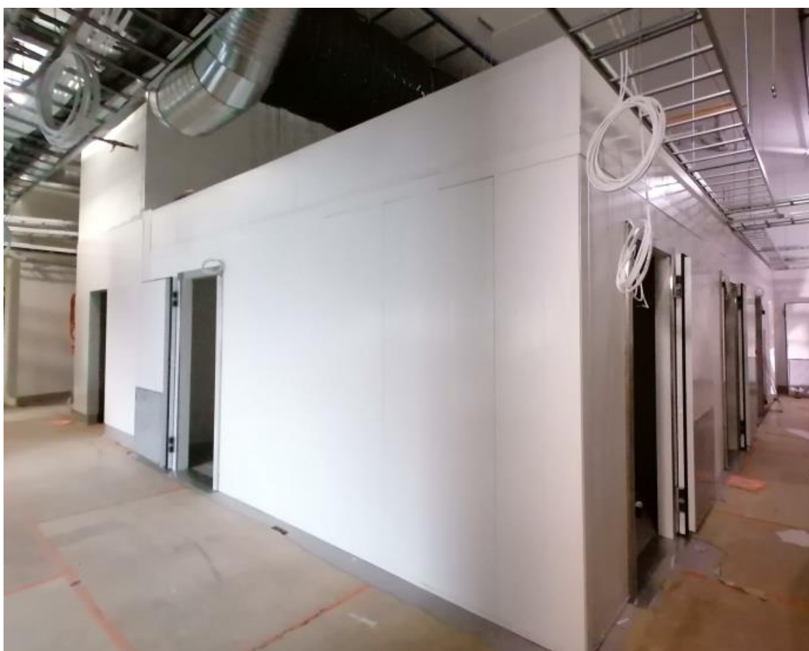
B-lohko 2. kerros / keittiö, kylmiöiden elementtiasennustyöt