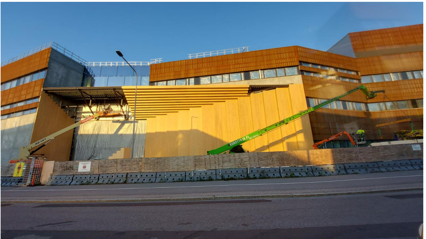
Itäinen julkisivu; pääsisäänkäynti puuaulaan. (A-lohko)