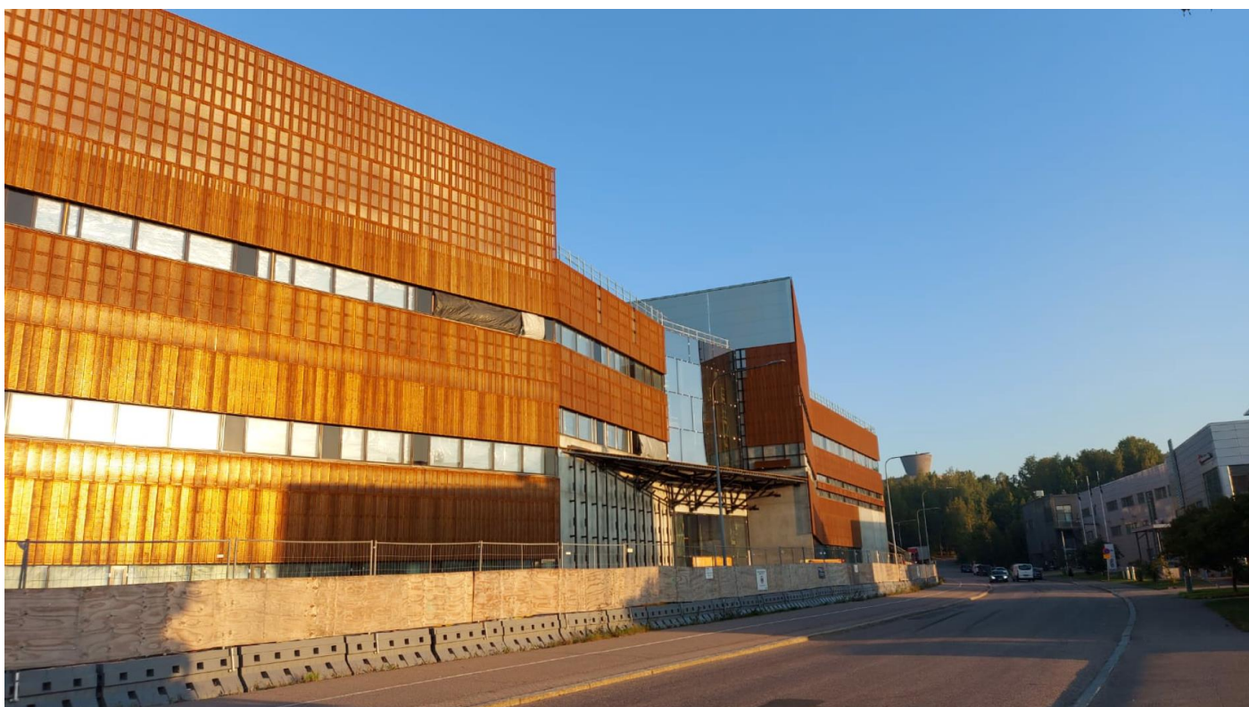
Itäinen julkisivu; pääsisäänkäynti metalliaulaan (C-lohko)